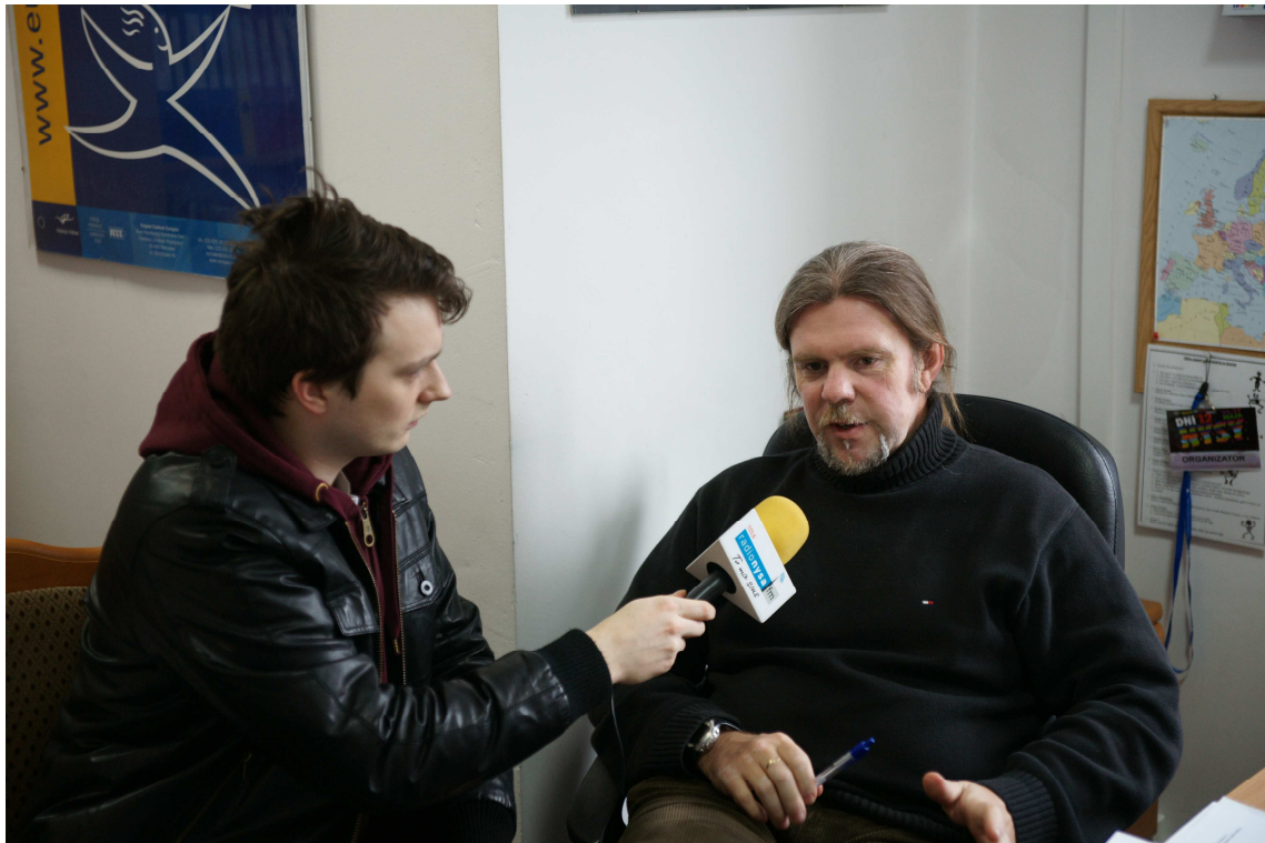
Wywiad z reporterem Radia Opole.